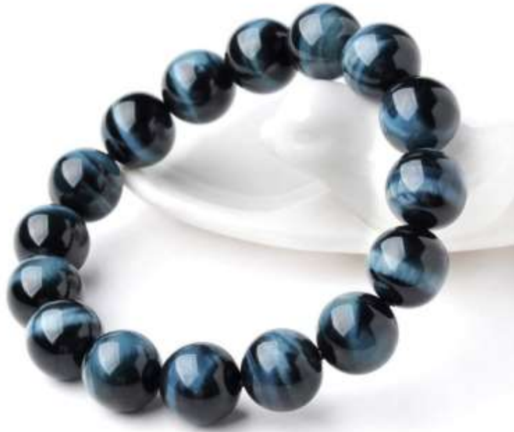
Đá mắt hổ xanh đen hay còn gọi là đá mắt hổ chim ưng.

Đá mắt hổ đỏ nâu là loại đá thứ ba trong dòng đá mắt hổ, hợp với những người mệnh Hỏa (tương hợp) và mệnh Thổ (tương sinh). Đây là loại đá khá hiếm trong dòng đá mắt hổ, là loại đá thánh cao quý nhất của người Ấn Độ.