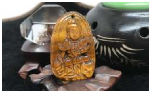
Mặt dây chuyền Phổ Hiền Bồ Tát đá mắt hổ.

Đá mắt hổ là một trong những loại đá quý có vẻ đẹp tự nhiên được đánh giá cao và giá trị phong thủy lớn nên được ưa chuộng trong ngành trang sức. Do đó, đá mắt hổ được chế tác ở dạng hạt tròn để làm trang sức như vòng tay, dây chuyền.