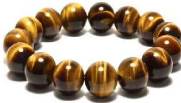
Đá mắt hổ vàng nâu.

Loại thứ nhất là đá mắt hổ vàng bao gồm đá mắt hổ vàng nâu và đá mắt hổ vàng tươi. Đây là loại phổ biến nhất, có hình dáng giống mắt mèo và phát sáng được trong đêm, thích hợp với những người mệnh Thổ (tương hợp) và mệnh Kim (tương sinh).