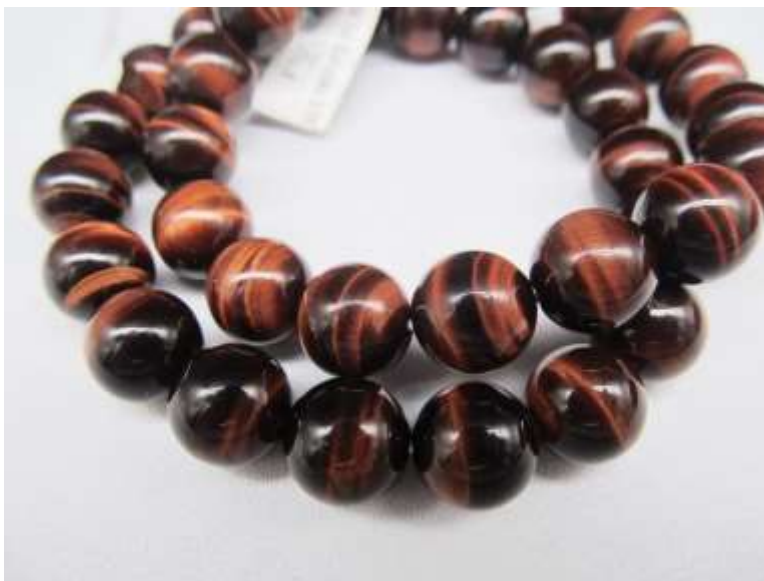
Đá mắt hổ đỏ nâu

Đá mắt hổ đỏ nâu là loại đá thứ ba trong dòng đá mắt hổ, hợp với những người mệnh Hỏa (tương hợp) và mệnh Thổ (tương sinh). Đây là loại đá khá hiếm trong dòng đá mắt hổ, là loại đá thánh cao quý nhất của người Ấn Độ.